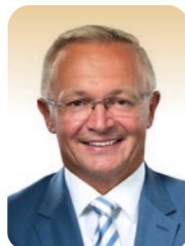
Achim Hallerbach Landrat Kreis Neuwied